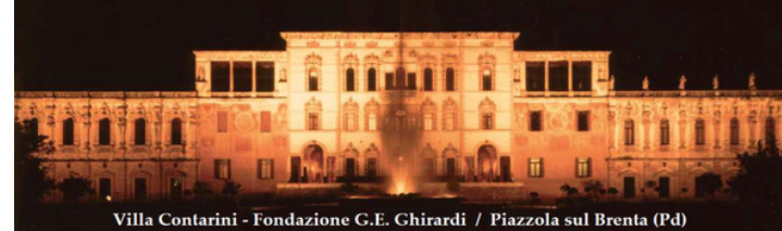
Villa Contarini - Fondazione G.E. Ghirardi / Piazzola sul Brenta (Pd)